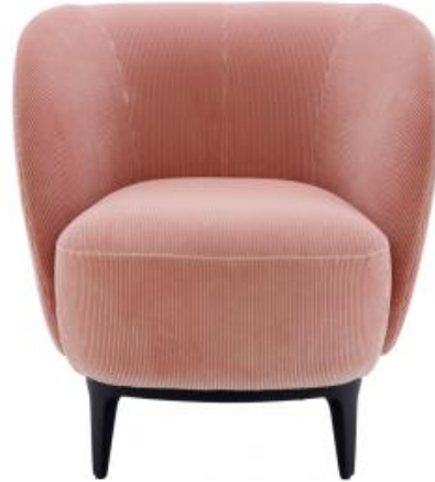
FAUTEUIL ARTICLE COMPLET