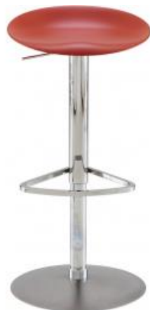
TABOURET HAUT BRIQUE