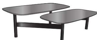
table basse plateau gres cerame anthracite metal pietement laque noir