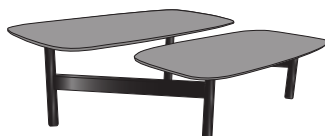
table basse plateau noyer pietement laque noir