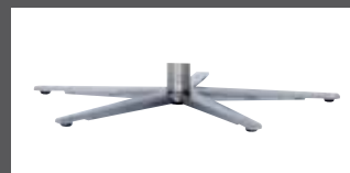
„S“ - pied étoilé chromé