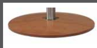
„A“ - Bois