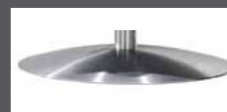
„N“ - acier