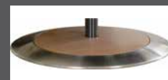
„D“ - bois serti inox