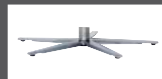
„U“ - pied étoilé acier