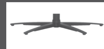
„V“ - pied étoilé recouvert par poudre anthracite

- toutes variantes électriques dispo avec batterie externe rechargeable en option.