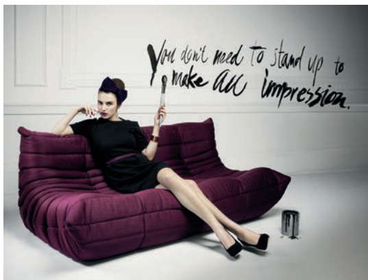
2011 — Agence Jung Von Matt © Liz Von Hoene, photographe.