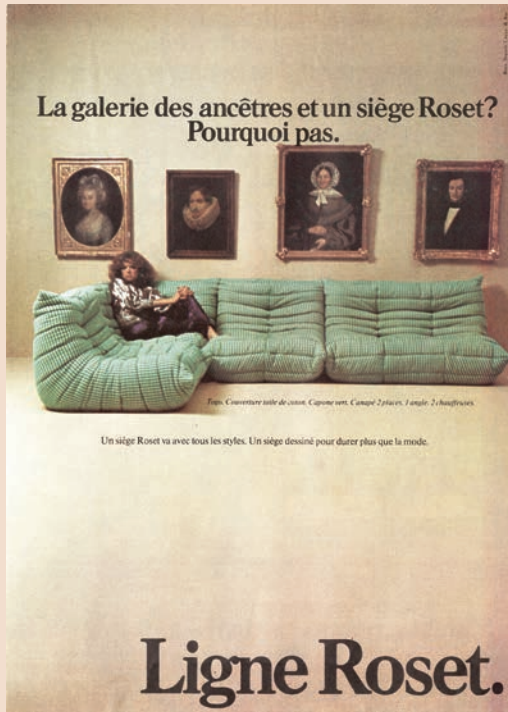
1974 — Agence Roux-Séguéla.