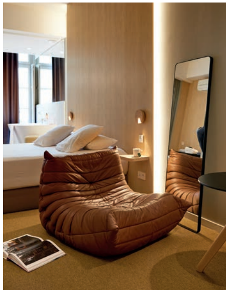
Mi Hotel Suites, Lyon