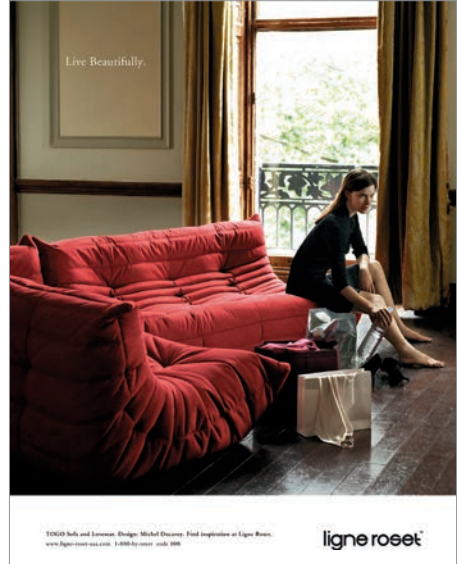
2005 — Agence BBDO GERMANY Finaliste Award Winner International Advertising Awards 2006, New York Festivals