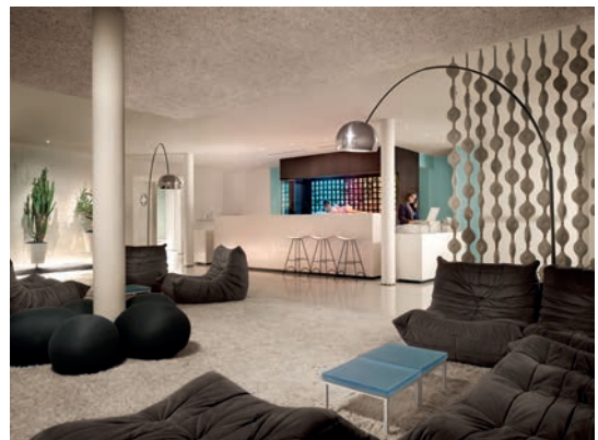
The Standard, Hollywood