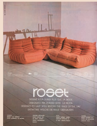
1987 — Direction Artistique François Bénard

Pierre Berville de l'agence Callegari Berville Grey imaginera aussi pour le modèle Togo une annonce publicitaire qui sera très remarquée et vaudra à Ligne Roset et son agence le prestigieux Grand Prix APPM 2004 (Association pour la Promotion de la Presse Magazine).