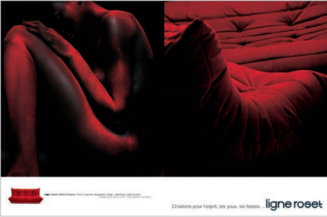
2004 — Agence Callegari Berville Grey Grand Prix APPM