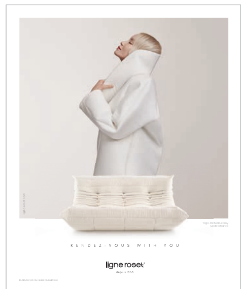
2021 — Agence Havas © Lauretta Suter.